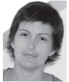
PIŠE: MR TATJANA PERIĆ

Poštovanje prava manjina, kao i uspostavljanje rodne ravnopravnosti, predstavljaju značajne elemente na putu ka evropskim integracijama. U tom kontekstu važno je govoriti i o ljudskim pravima