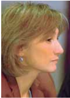
PIŠE: DR SNJEŽANA MILIVOJEVIĆ

Žene su u fokusu svega deset odsto svih informativnih priloga u Srbiji, što govori ne samo o "nevidljivosti žena" koje čine polovinu stanovništva već je ujedno i dokaz beznačajnosti koje kulutra pridaje njihovim mišljenjima, delovanju, pa i postojanju