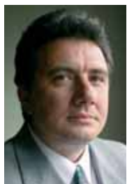
PIŠE: DR JOVAN TEOKAREVIĆ

Iako položaj žena u Evropskoj uniji nije idealan, bolji je od situacije kod nas, pa bi i u ovoj oblasti bilo dobro imati više, a ne manje Evrope