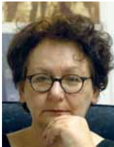
PIŠE: DR SVETLANA SLAPŠAK

Ne treba nasedati, našim američkim kolegicama nikada nije bila potrebna evropska politička podrška, ali to nimalo ne treba da smanji ono što bih otvoreno nazvala – prosvjećivanjem i kritičkom svešću koja dolazi iz liminalnih područja