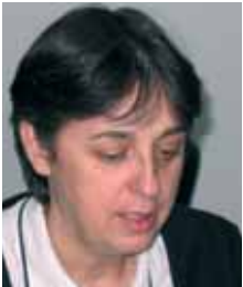
PIŠE: DR DAŠA DUHAČEK

Za razliku od zemalja Evropske unije, ali i Zapadnog Balkana, Srbija još nema sve sistemske pretpostavke za ostvarenje rodne ravnopravnosti