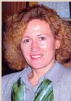
PIŠE: MILEVA MALEŠIĆ

Medijsko nipodaštavanje žena je pažljivo negovano kulturno dostignuće