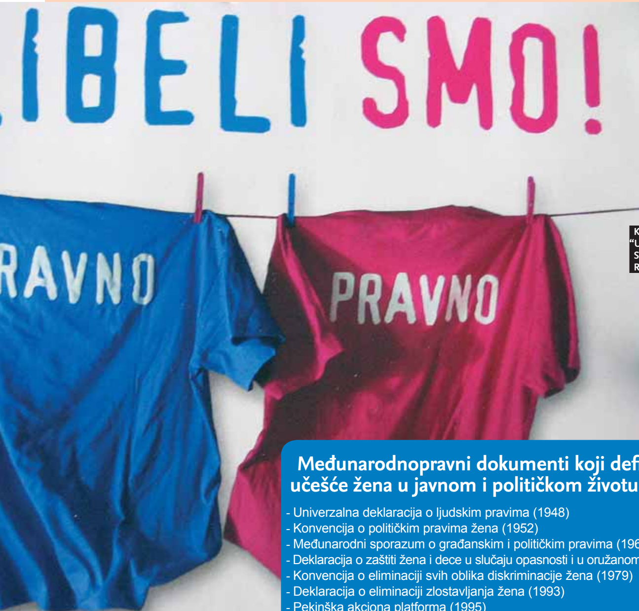
KAMPANJA “U LIBELI SMO” SAVETA ZA RODNU RAVNOPRAVNOST

Autorka je koordinatorka Centra za ženske studije