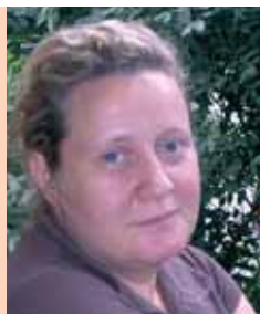
PIŠE: JELISAVETA BLAGOJEVIĆ

Pretpostavke o razlici između polova za sobom povlače i različite načine osposobljavanja pripadnika jednog , odnosno dru-