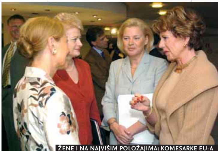
ŽENE I NA NAJVIŠIM POLOŽAJIMA: KOMESARKE EU-A

Autor je direktor BeCEI-a i docent na Fakultetu političkih nauka