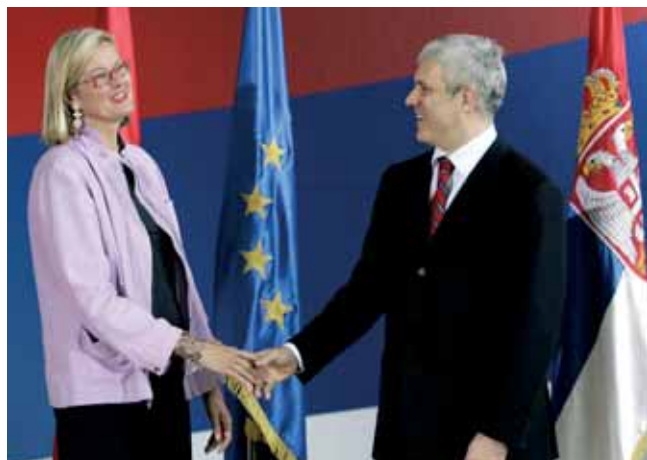
URSULA PLASNIK, ŠEFICA AUSTRIJSKE DIPLOMATIJE, SA PREDSEDNIKOM SRBIJE BORISOM TADIĆEM U BEOGRADU, 30. JUNA

pregovora Srbije i Unije o Sporazumu o stabilizaciji i pridruživanju, koji su suspendovani u maju. – Evropska komisija predložila je Savetu EU-a direktivu o pregovorima o Sporazumu o stabilizaciji i pridruživanju sa Crnom Gorom (nakon sticanja nezavisnosti), kao i izmenjenu direktivu o pregovorima