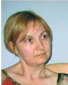
PIŠE: TANJA IGNJATOVIĆ

Budući da izbor rodnog identiteta nije jednoznačan, niti je prirodan i nepromenljiv, zakonska rešenja bi trebalo da anticipiraju mogućnost postojanja višestruke polnosti