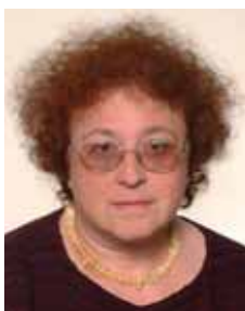
PIŠE: DR DRAGANA POPOVIĆ

Žene su pretežno nastavnice u osnovnim školama, gde čine 71,8 odsto ukupnog broja zaposlenih, a muškarci na fakultetima, gde učestvuju u ukupnom broju zaposlenih sa 70,6 odsto. Od osnivanja 1905. godine, Univerzitet u Beogradu imao je samo jednu rektorku, a u Savetu BU-a samo je 26,5 odsto žena