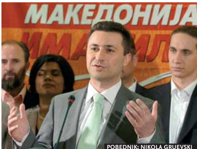
POBEDNIK: NIKOLA GRUEVSKI

6. jul – Komesar za proširenje EU-a Oli Ren ponovio je u Beogradu da puna saradnja Srbije s Haškim tribunalom, što podrazumeva hapšenje i izručenje generala Ratka Mladića, ostaje neophodan uslov za nastavak